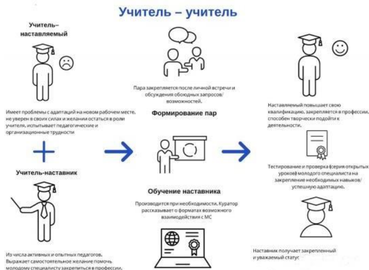
Рис.2. Модель взаимодействия «учитель-ученик»

Целью такой формы наставничества является успешное закрепление на месте работы или в должности педагога молодого специалиста, повышение его профессионального потенциала и уровня, а также создание комфортной профессиональной среды внутри образовательной организации, позволяющей реализовывать актуальные педагогические задачи на высоком уровне. Среди основных задач взаимодействия наставника с наставляемым: способствовать формированию потребности заниматься анализом результатов своей профессиональной деятельности; развивать интерес к методике построения и организации результативного учебного процесса; ориентировать начинающего педагога на творческое использование передового педагогического опыта в своей деятельности; прививать молодому специалисту интерес к педагогической деятельности в целях его закрепления в образовательной организации; ускорить процесс профессионального становления педагога; сформировать сообщество образовательной организации (как часть педагогического).