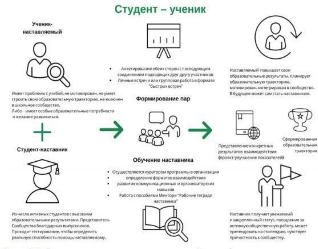
Рис.3. Модель взаимодействия «студент-ученик»

Целью такой формы наставничества является успешное формирование у ученика представлений о следующей ступени образования, улучшение образовательных результатов и мотивации, расширение метакомпетенций, а также появление ресурсов для осознанного выбора будущей личностной, образовательной и профессиональной траекторий развития.