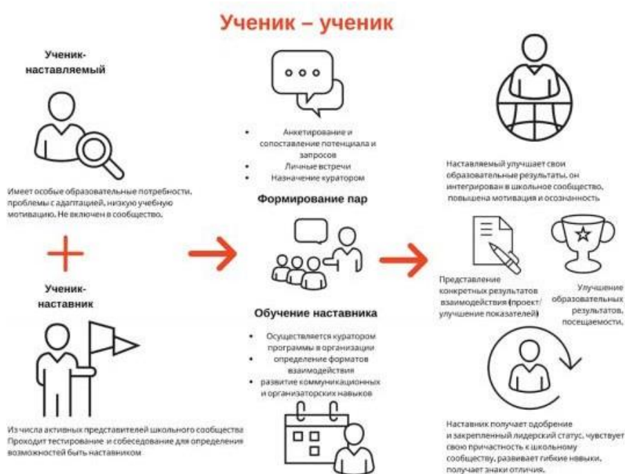
Рис.1. Модель взаимодействия по форме «ученик-ученик»

Предполагает взаимодействие обучающихся одной образовательной организации, при котором один из обучающихся находится на более высокой ступени образования и обладает организаторскими и лидерскими качествами, позволяющими ему оказать весомое влияние на наставляемого, лишнее тем не менее строгой субординации. Вариацией данной формы является форма наставничества «студент – студент».